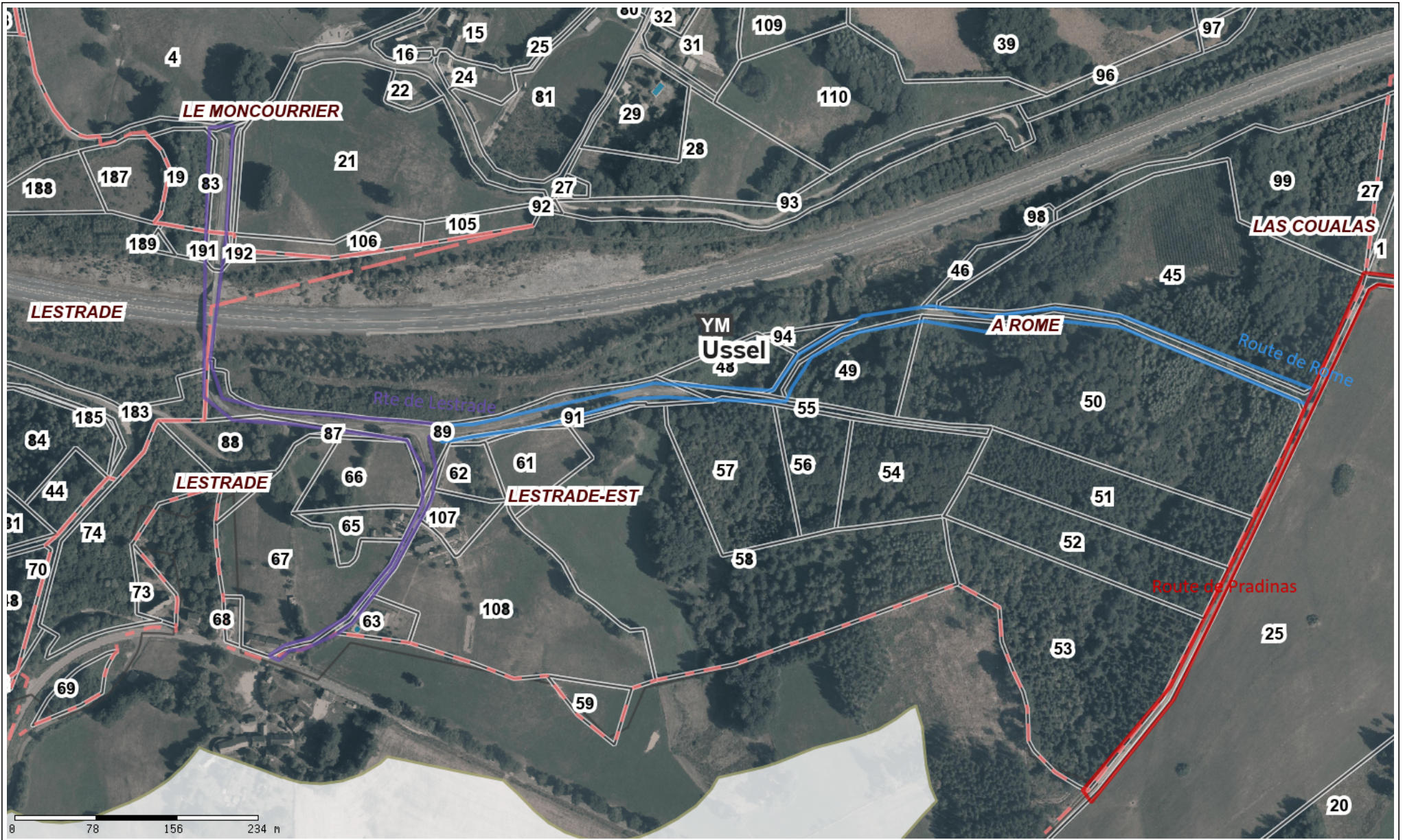
Route de Lestrade et Route de Rome